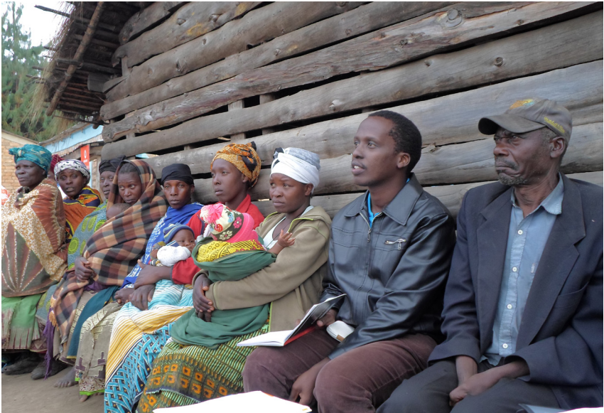
Picha 2: Sehemu ya wanakijiji waliohudhuria mahojiano utafiti katika kijiji cha Idasi, Kilo