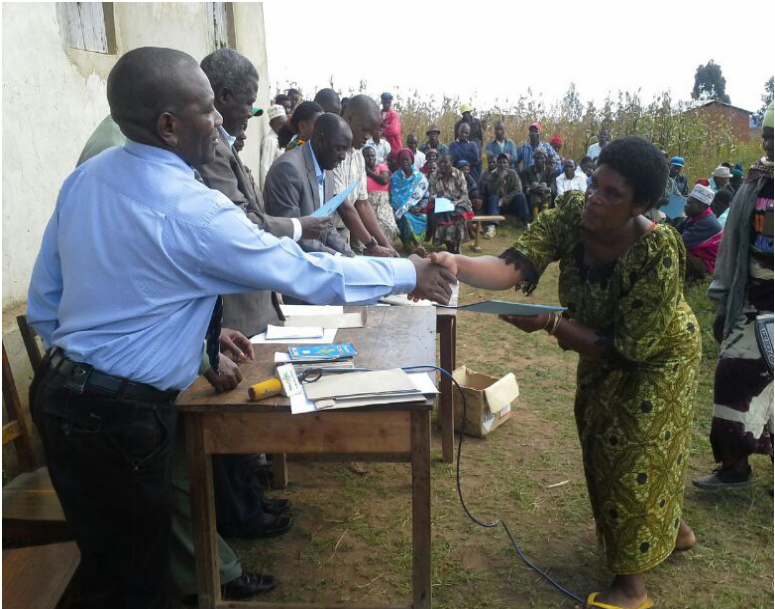
Picha 7: Wananchi wa kijiji cha Kihesamgagao wakipokea vyeti vya hatimiliki za kimila.