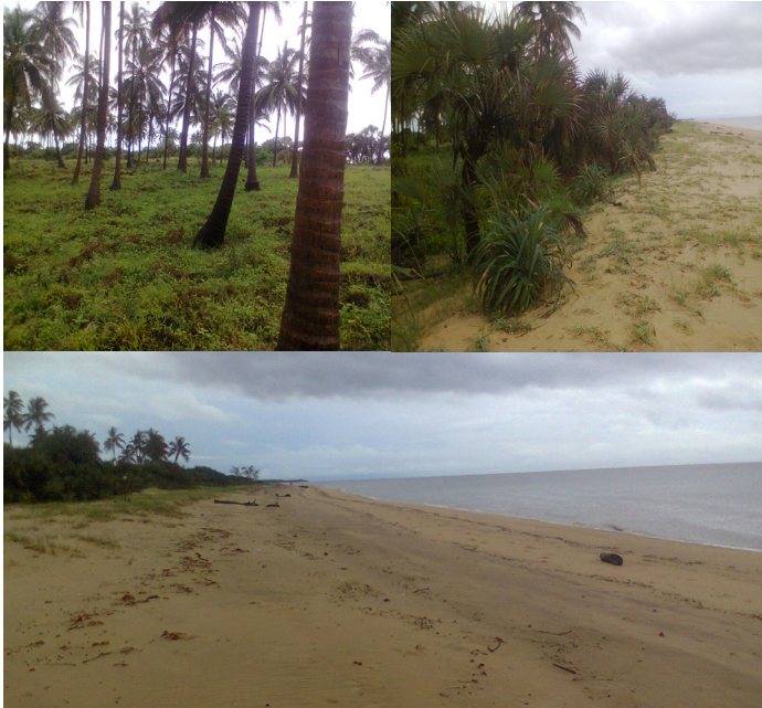
Picha 1: Eneo la fukwe katika kitongoji cha Uvinje, kijiji cha Saadani

kufanya utafiti hapo tarehe 8 – 14 Aprili 2014 kwa lengo la kupata ukweli kuhusiana na mgogoro husika hasa kuhusiana na vyanzo, athari na hatua za utatuzi wa mgogoro husika zilizochukuliwa na mamlaka mbalimbali katika nyakati tofauti.