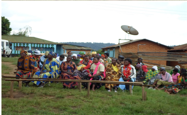
Picha 3: Baadhi ya wananchi waliohudhuria Mkutano Mkuu kijijini Kidabaga, Kilolo