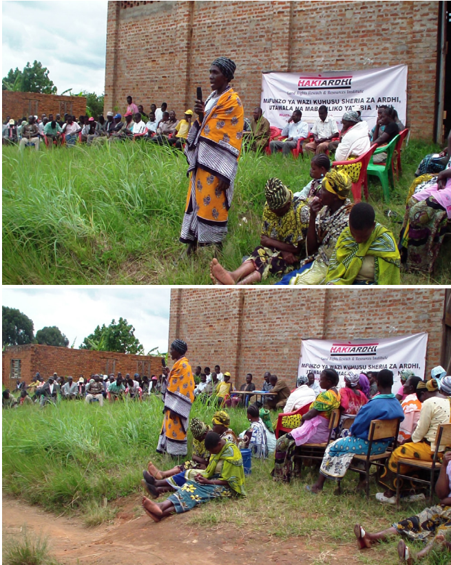
Picha 5: Wananchi wakishiriki kwenye mjadala wa wazi wilayani Kilolo na Mufindi