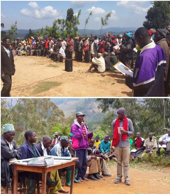
Picha 6: Wananchi wa kijiji cha Ipilimo, Mufindi wakishiriki katika mjadala wa wazi

Masuala yaliyoibuka ni pamoja na migogoro ya mipaka, migongano ya ugawaji mali inayohusisha ardhi katika suala la mirathi ambapo mila imekuwa ikizingatiwa zaidi, ilibainika uuzaji wa ardhi upo katika vijiji vyote. Pia vyombo vya usimamizi wa ardhi katika vijiji hivi vinaitaji mafunzo zaidi maana majukumu mengi kwa mujibu wa sheria yalionekana kutofahamika au kueleweka hususani katika utekelezaji wake.